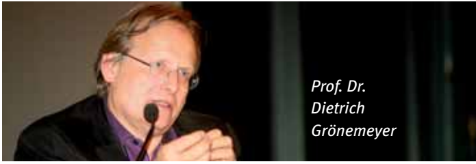
Prof. Dr. Dietrich Grönemeyer